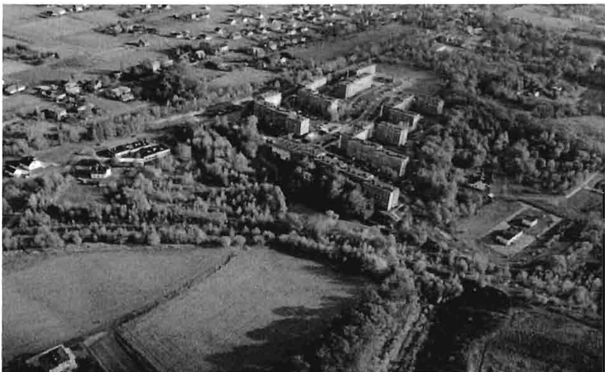
Osiedle Górniczej Spółdzielni Mieszkaniowej