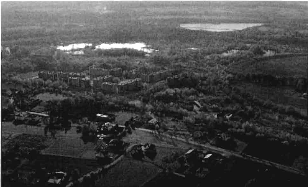
Widok ogólny- w tle graniczna rzeka Olza