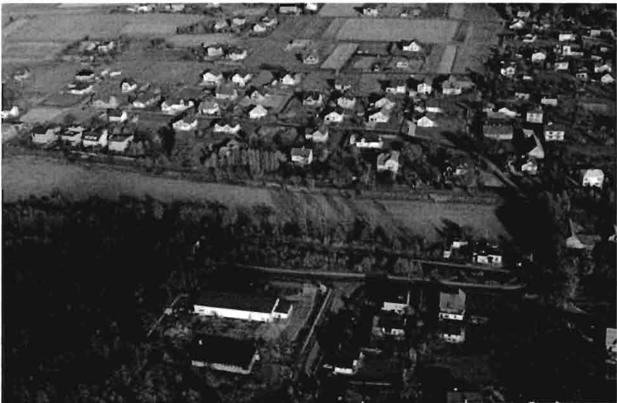
Widok ogólny- na pierwszym planie linia kolejowa