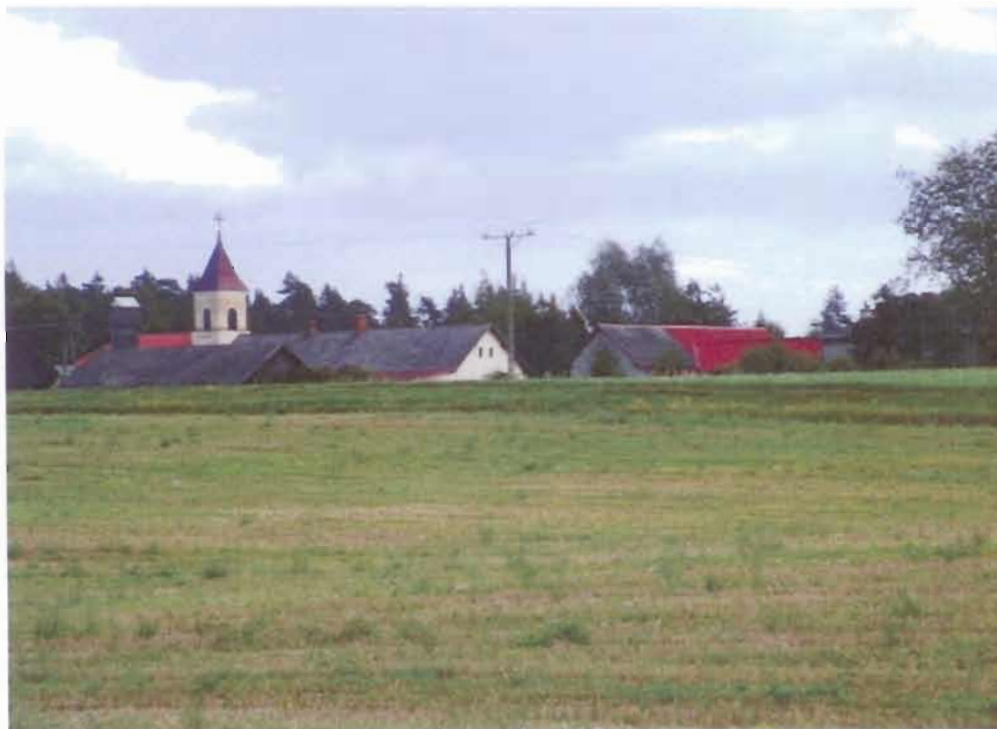
Kaplica Najświętszej Marii Panny