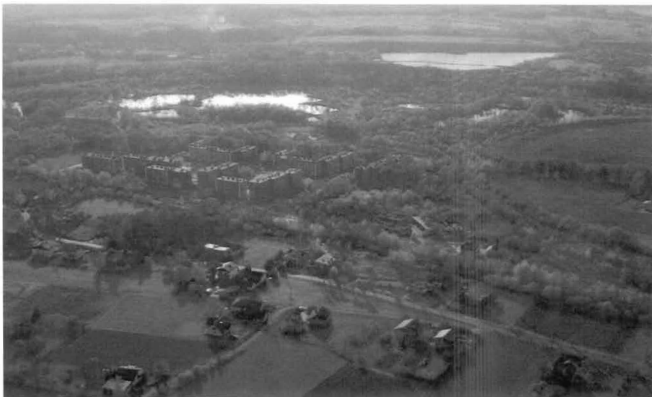
Widok ogólny- w tle graniczna rzeka Olza