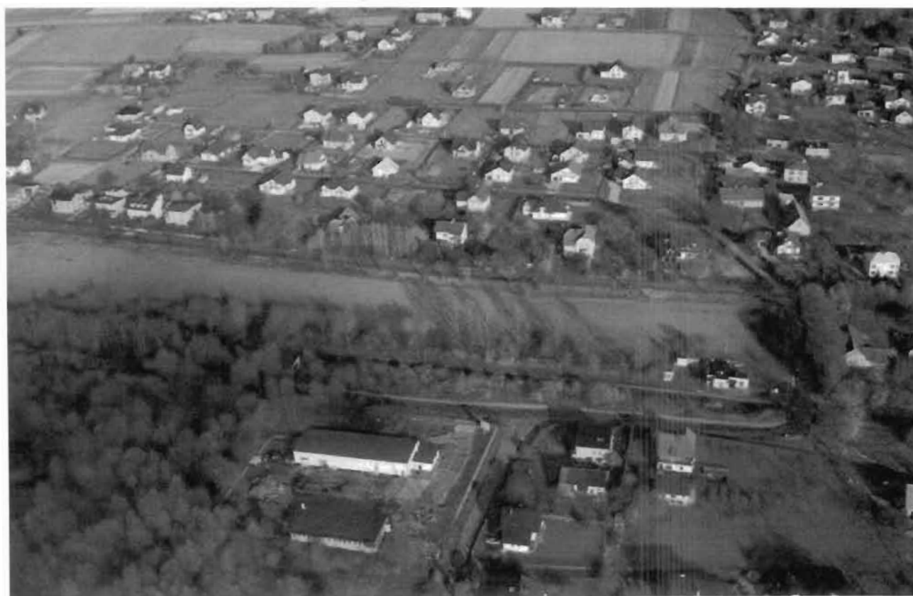
Widok ogólny- na pierwszym planie linia kolejowa