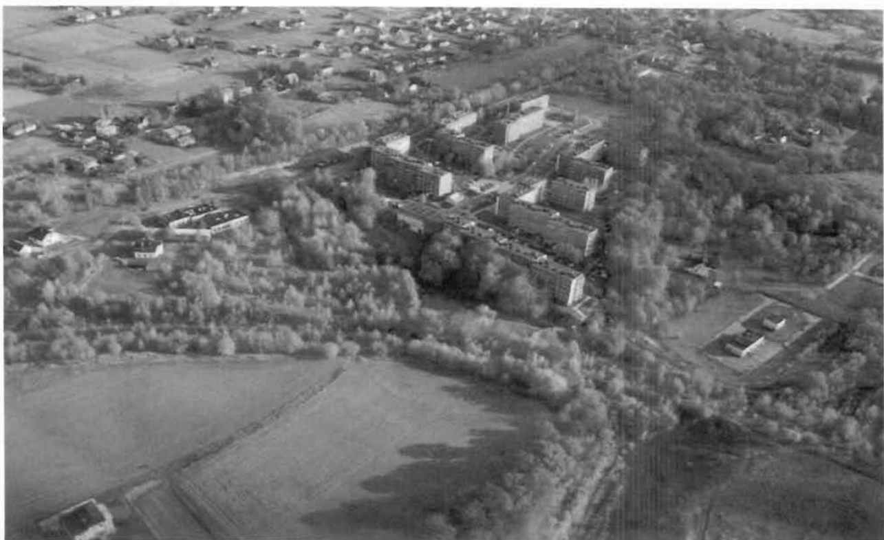
Osiedle Górniczej Spółdzielni Mieszkaniowej